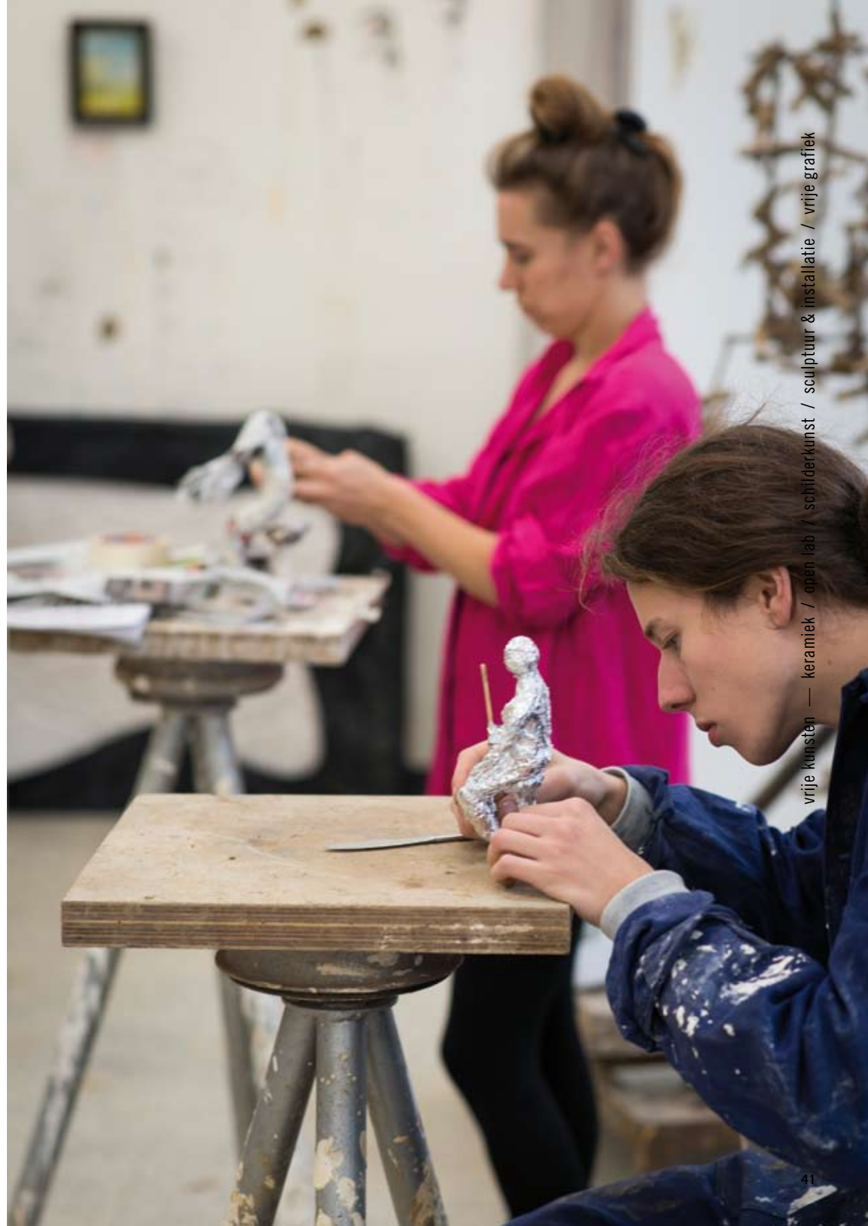
vrije kunsten — keramiek / open lab / schilderkunst / sculptuur & installatie / vrije grafiek