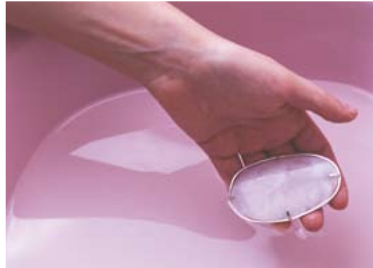
alumna